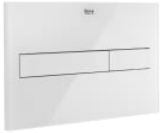
PL7 DUAL (ONE) - Placa de accionamiento con descarga dual con acabados cristal