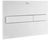
PL7 DUAL (ONE) - Placa de accionamiento con descarga dual con acabados mate